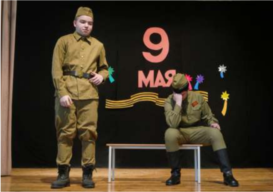
ФОТО С ПРОШЕДШЕГО КОНЦЕРТА В ЧЕСТЬ 9 МАЯ